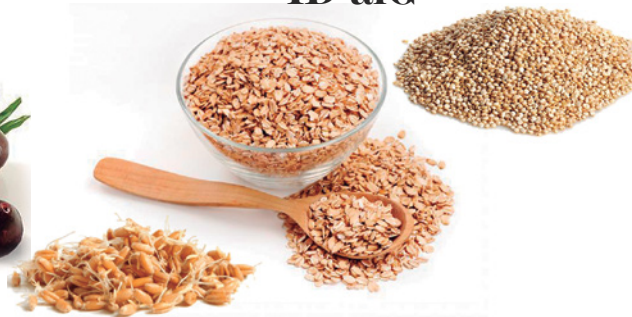
Alimentos que potencializam a redução de absorção de carboidratos (ID-alG)

ID-alG é o Extrato Premium da alga marrom, proveniente das costas rochosas do Atlântico Norte. Fonte natural de ingredientes vitais, Oligoelementos, proteínas, aminoácidos, Minerais e Polifenóis Marinhos (Florotaninos). A sinergia entre os componentes proporcionam a ação do ativo e os benefícios da reposição dos minerais. Possui tripla ação no gerenciamento do peso: age inibindo a atividade das enzimas \alpha -amilase, \alpha -glucosidase e lipase, reduzindo a absorção de carboidratos e gordura. Além disso, é capaz de acelerar o metabolismo através da ação termogênica e, por consequência, auxilia a reduzir a gordura corporal.