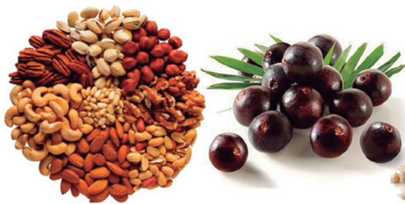
Alimentos que potencializam a saciedade e energia (Go BHB)

Go BHB é fonte do corpo cetônico beta-hidroxibutirato apresentado na forma de um blend de sódio, cálcio e magnésio. Cetonas exógenas como o Go BHB mimetizam a cetose nutricional, trazendo todos os benefícios da utilização dos corpos cetônicos, sendo eles: mais energia física e mental, performance e saciedade. A elevação de beta-hidroxibutirato no sangue também é responsável pela redução do apetite, desejo de comer e sensação de saciedade mediada pela redução dos níveis de grelina. Dessa forma, Go BHB é um aliado importante no gerenciamento do peso, sendo fonte de energia para o organismo potencializando dietas restritas como: cetogênica, low carb e algumas estratégias como o jejum intermitente.