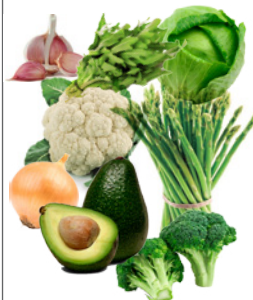
Alimentos que auxiliam no processo de detoxificação e fonte de glutatona

favorecendo a detoxificação. Ativo natural extraído das folhas da Cynara cardunculus L. var. altilis (DC) padronizado em altas concentrações de biocompostos detoxificantes com ação hepatoprotetora, coléretica e anticoléstatca, que ajudam o organismo a eliminar as toxinas promovendo o equilíbrio nutricional e o gerenciamento do peso.