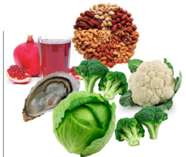
Alimentos que ↑ testosterona Alimentos fonte de Zn Alimentos fonte de Mg