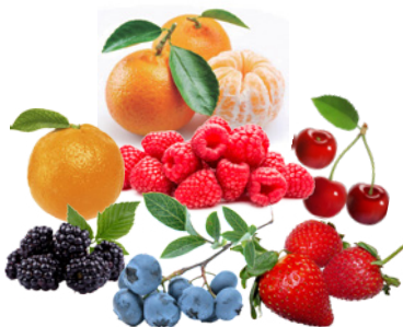
Alimentos ricos em antocianinas e flavanóis

Morosil® é obtido a partir do suco da laranja vermelha Moro rica em antocianina C3G (cianidina-3-glicosídica), que promove a modulação gênica, reduz a expressão de genes lipogênicos (LXR e FAS) e aumenta a atividade de enzimas lipolíticas (PPRgama e PPRalfa), diminuindo a gordura abdominal e auxiliando no gerenciamento do peso.