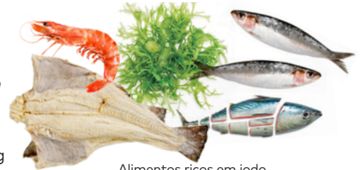
Alimentos ricos em iodo

I-Plus , a alga marrom da Noruega pura e seca, que possui em sua composição; Minerais, Vitaminas, Polifenóis, Florotanninos, Fucoidanos, Fucoxantina, Ácido Alginico e uma alta concentração de Iodo biodisponível.