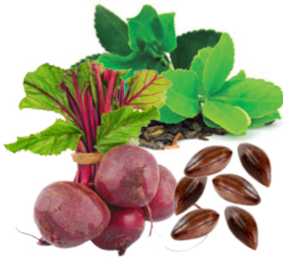
Alimentos que ↑ a vasodilatação, recuperação muscular e síntese endógena de antioxidantes